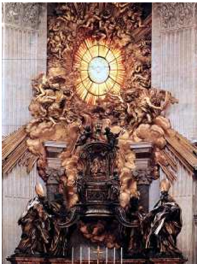
Honorowe miejsce nauczania - katedra

Po grecku słowo kathédra i po łacinie cathedra oznacza "krzesło". Zazwyczaj z takiego honorowego miejsca biskup pouczał wiernych. Ojcowie Kościoła używali tego symbolu do wyrażenia władzy biskupiej. Szczególnie zaś odnosili go do rzymskiej stolicy św. Piotra.