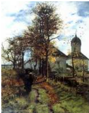
Opuszczona plebania, autor: Adam Chmielowski (Brat Albert)